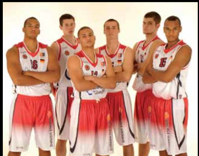
Können auch in der ProA mit viel Spielzeit rechnen: Die jungen Ursprungsschüler